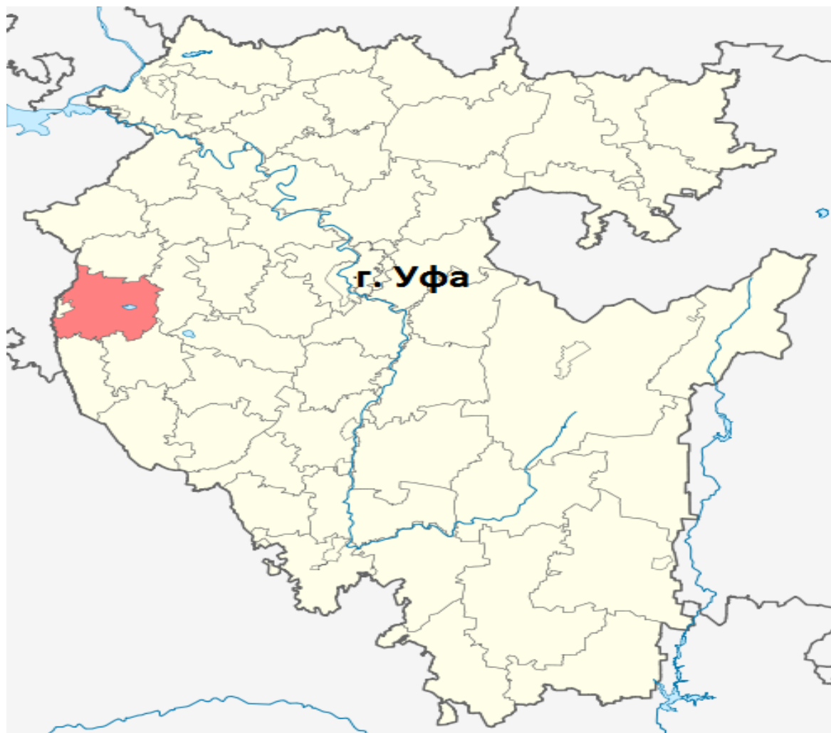
Рисунок 1 - Янаульский район на карте

Сельское поселение Байгузинский сельсовет расположен в юго-западной части Муниципального района Янаульский район. Территория сельсовета граничит с севера – с территорией Муниципального района Новоартаульский, с северо-востока – с территорией Муниципального района Шудекский, с юго-востока – с территорией Муниципального района Первомайский, с запада с территориями сельских поселений Муниципального района Янаульский район: Старокудашевский, Кисак-Каинский.